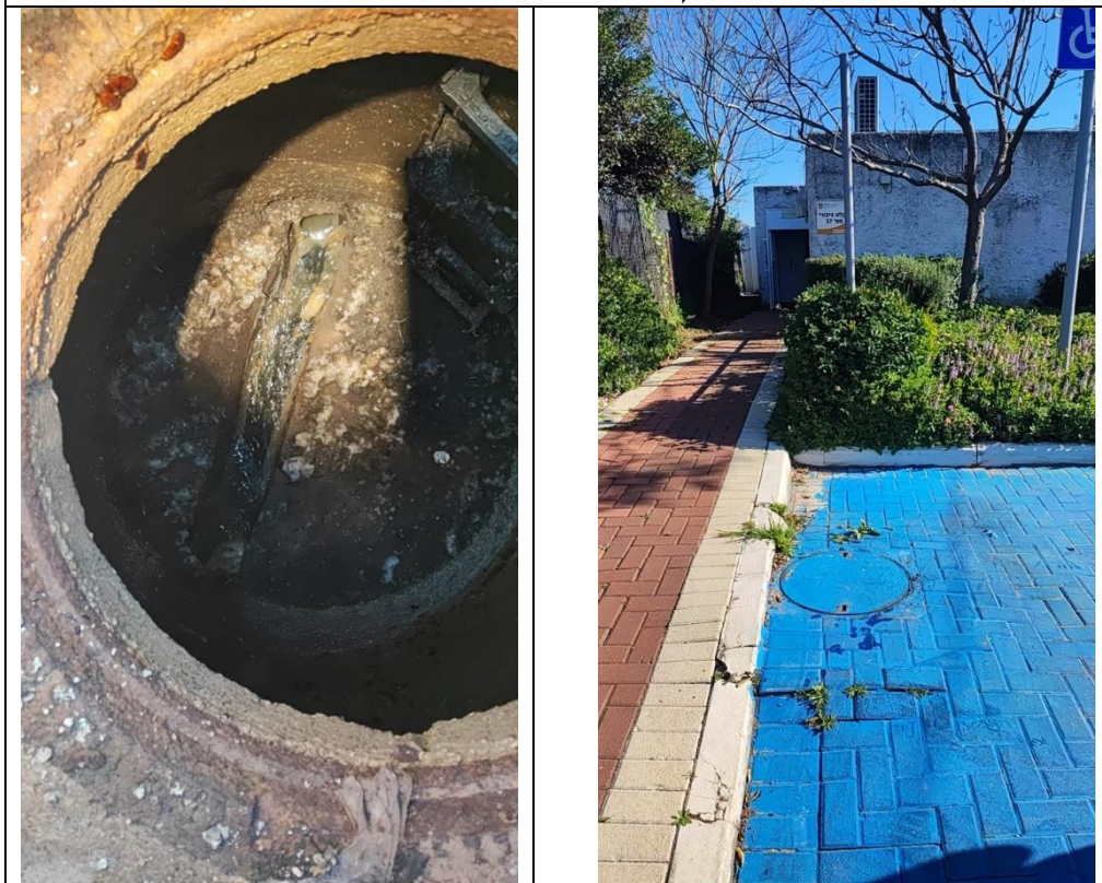
נקודה מס' 4 שבטבלה 1