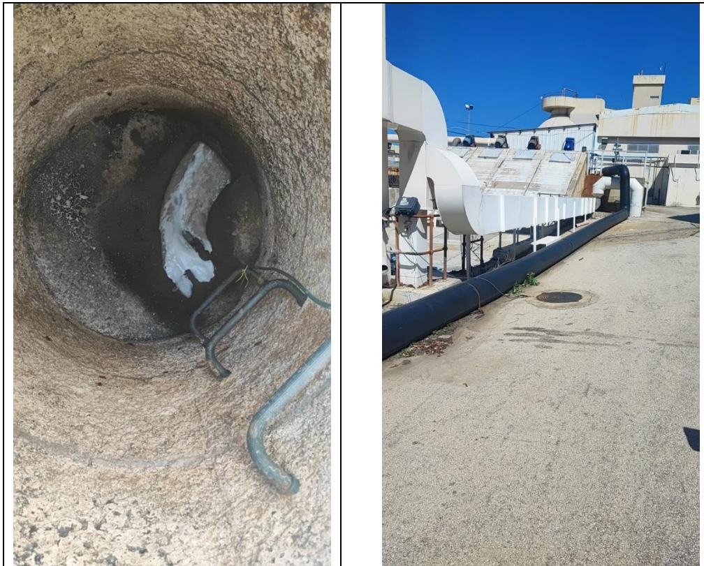
נקודה מס' 7 שבטבלה 1