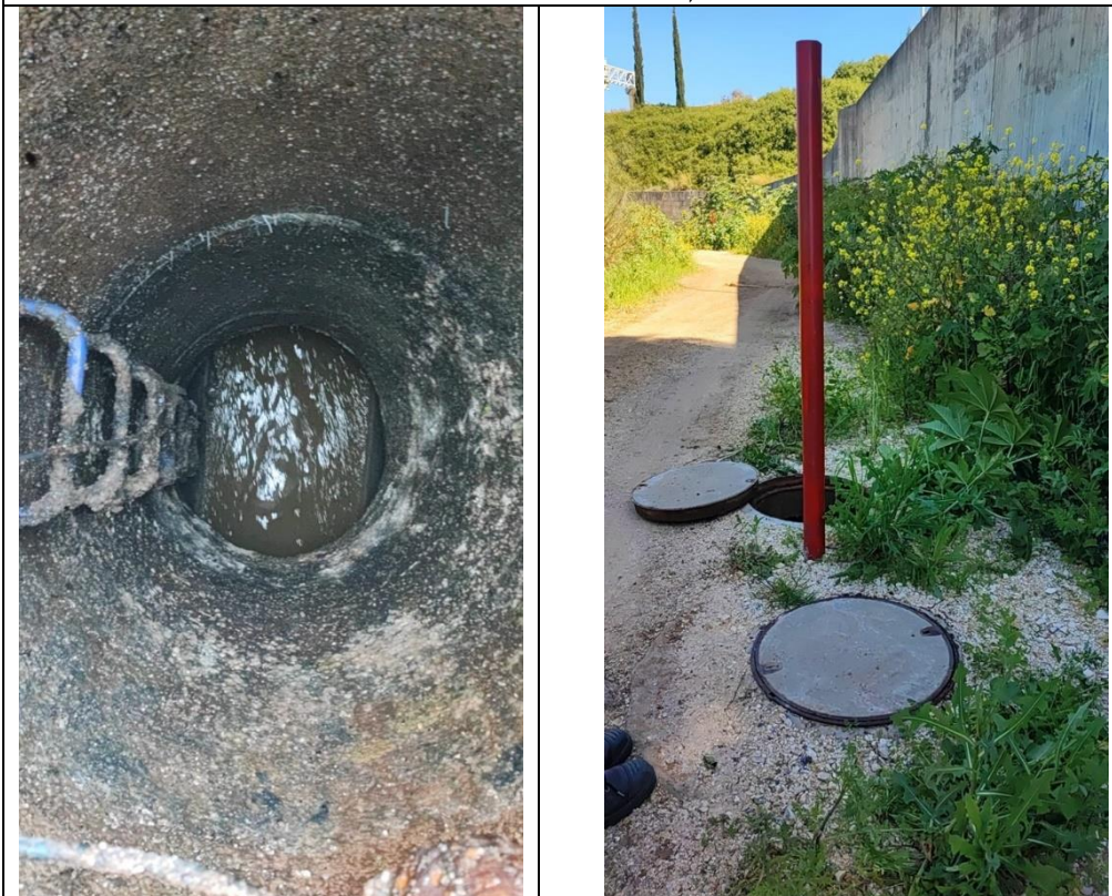
נקודה מס' 6 שבטבלה 1