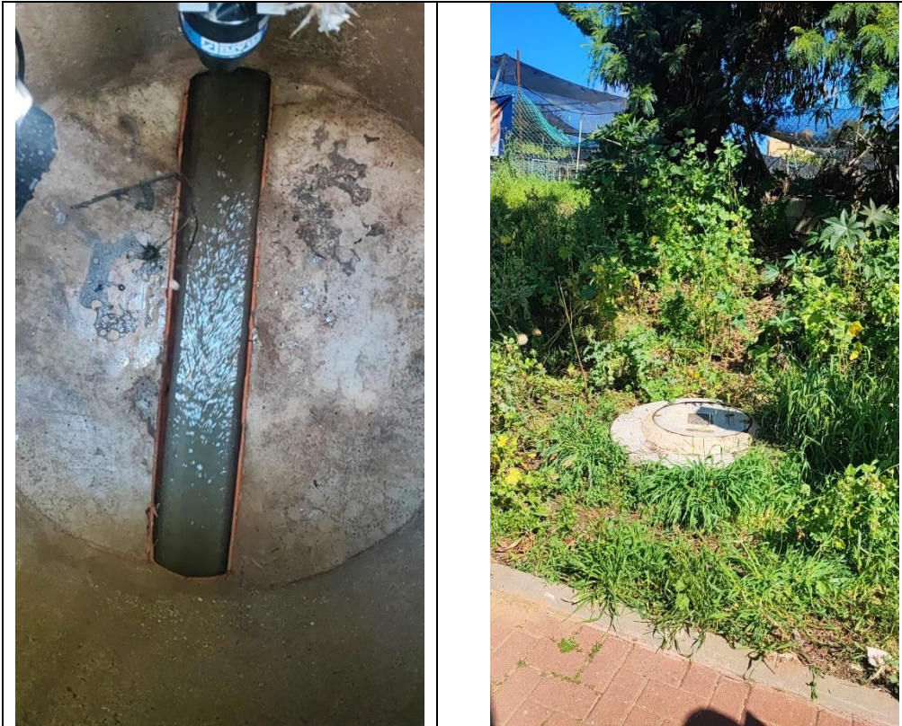
נקודה מס' 5 שבטבלה 1